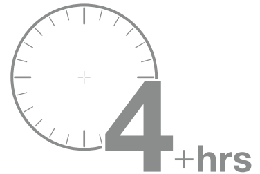
CUATRO HORAS DE ASESORAMIENTO CON UN ASESOR EN INVESTIGACIÓN APLICADA