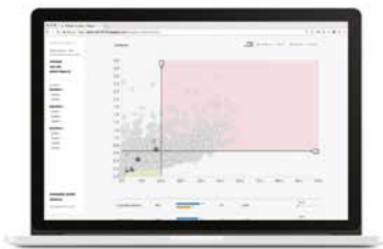
PANEL EN VIVO DURANTE EL ESTUDIO

Cada compromiso incluye un panel interactivo en vivo durante el estudio, un informe con ideas y perspectivas basadas en los datos y cuatro horas de asesoramiento en persona con un miembro del equipo de Investigación y Asesoría Aplicadas de Steelcase.