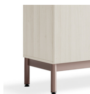
Socle avec pieds et goulotte de H200mm*

*Compatible avec les serrures connectées câblées.