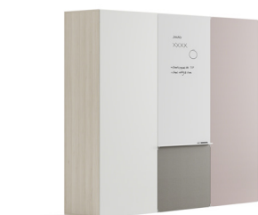
Tableau blanc*, mélamine, textile