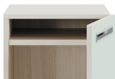
Étagère à courrier fixe** (pour les casiers de H400mm ou plus)