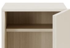
Étagère encastrée réglable** (pour les casiers de H400mm de hauteur ou plus)