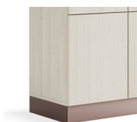
Plinthe de H100mm*