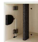
Gaine de câble (Gestion verticale des câbles pour serrures câblées en réseau)

**Options disponibles uniquement pour les unités avec portes. ***Conçu pour un ordinateur 16", voir les fiches techniques pour les dimensions précises