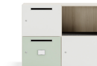
Fente à lettres, porte-étiquette, revêtement intérieur en PET (pour les compartiments ouverts)