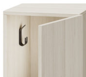
Crochet pour veste/sac** (pour les casiers de H750mm de hauteur ou plus)