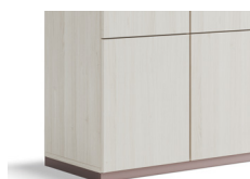
Plinthe de H40mm