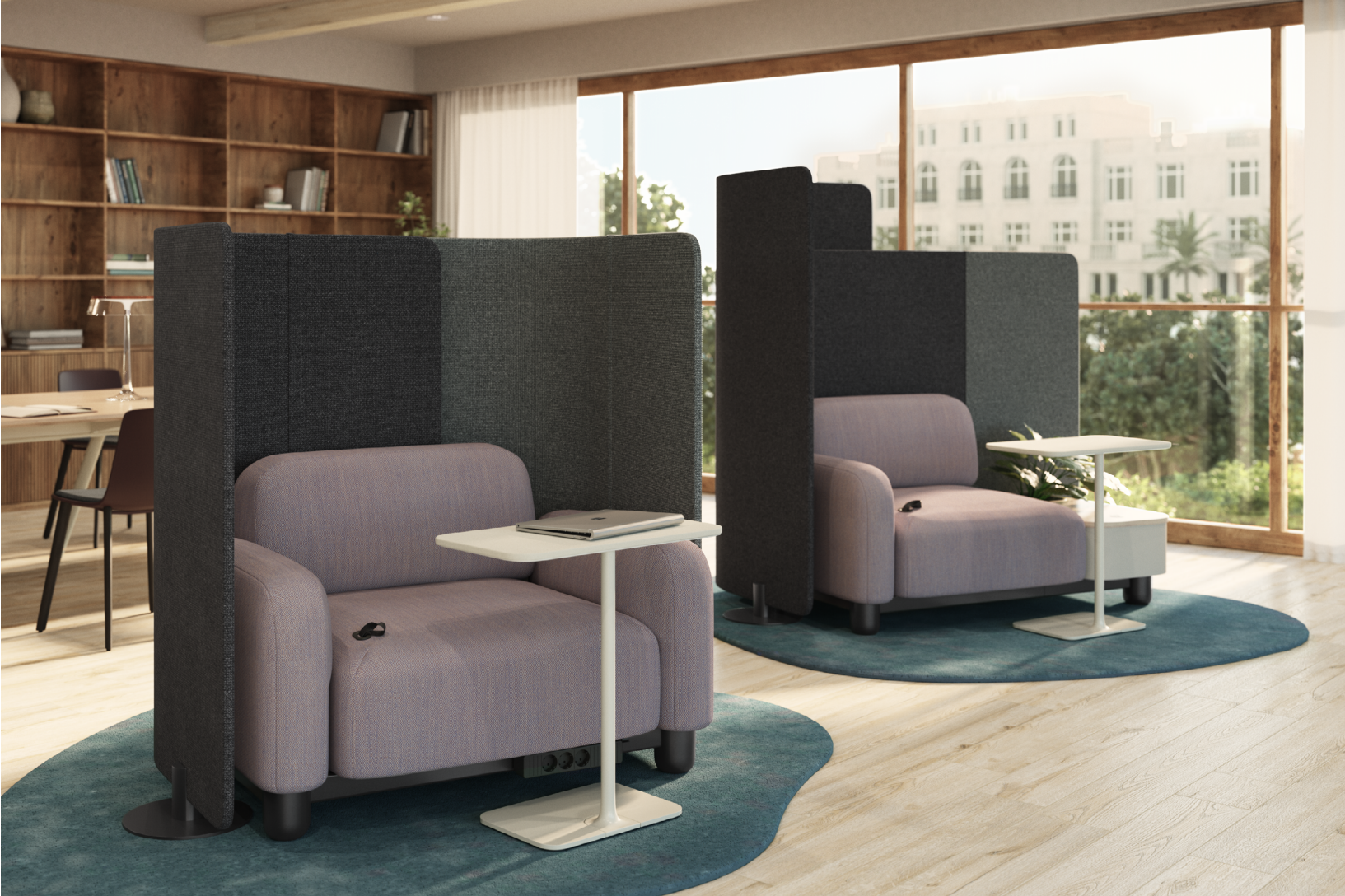
Les modules universels peuvent être assemblés d'innombrables façons et s'harmonisent avec de nombreux autres styles de meubles.