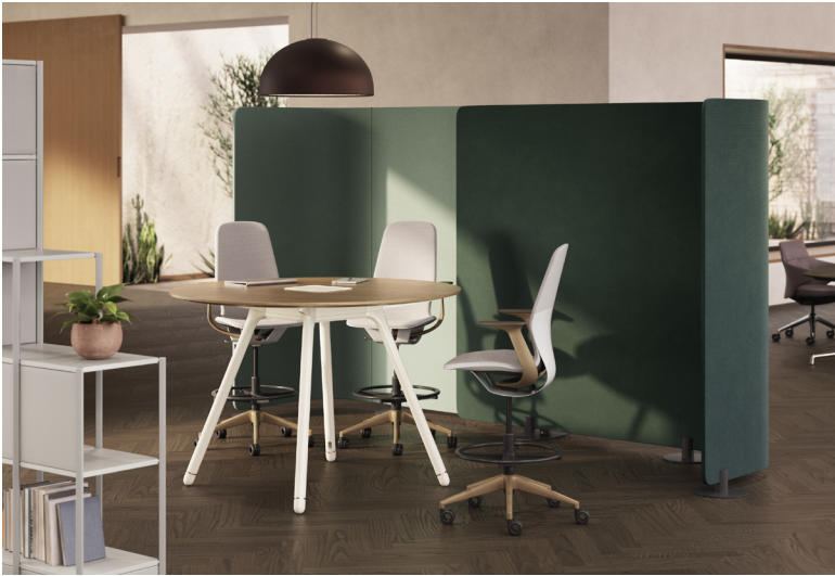
Les écrans autoportants sont dotés d'éléments amovibles à glissière pour un montage et un démontage faciles, ce qui permet de les reconfigurer et de les réutiliser.