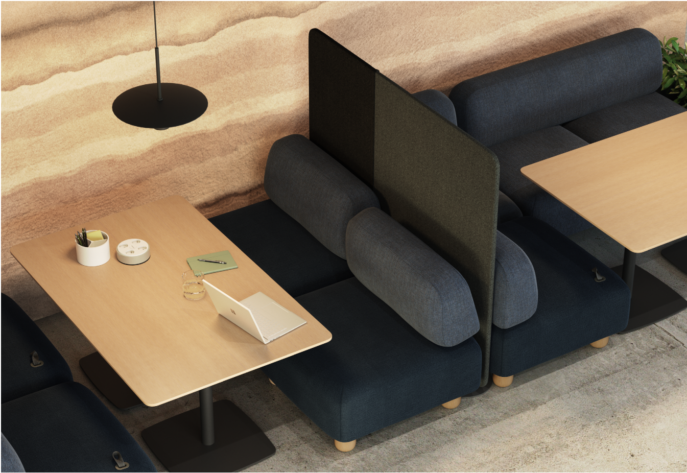
Les applications de la collection Ensemble associées aux bureaux et tables individuelles Lagunitas de 660 mm de hauteur signées Coalesse.

Le système modulaire universel permet à tous les éléments de s’emboîter. Grâce à un système de rails convivial et évolutif, les assises, les tables, les jardinières et les écrans interagissent pour former des configurations flexibles qui peuvent s’agrandir et changer en toute fluidité au fil du temps. Choisissez les modules qui répondent à vos besoins.