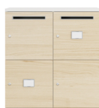
Ranura para cartas + tarjetero identificador