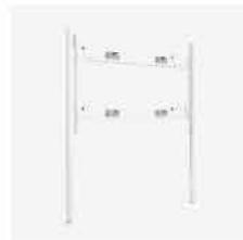
85英寸落地式壁挂支架