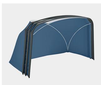
Table Tent 内里空间很宽敞，显示屏支架、电源和扩充口均可轻松纳入其中。