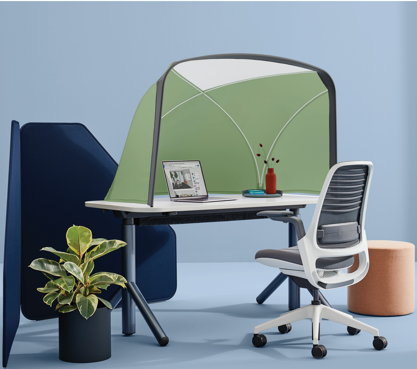
Table Tent 为需要专注的人提供个人隐私保护。三面加头顶区域的防护，快速将任何办公桌、工作台等区域变成一个适合工作的安全私密区。Table Tent 可配置各种科技设备，无需夹子或夹托，易于安装，易于移动。