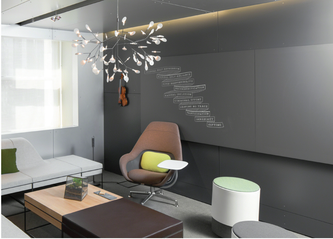
灰色粉笔 6502 C