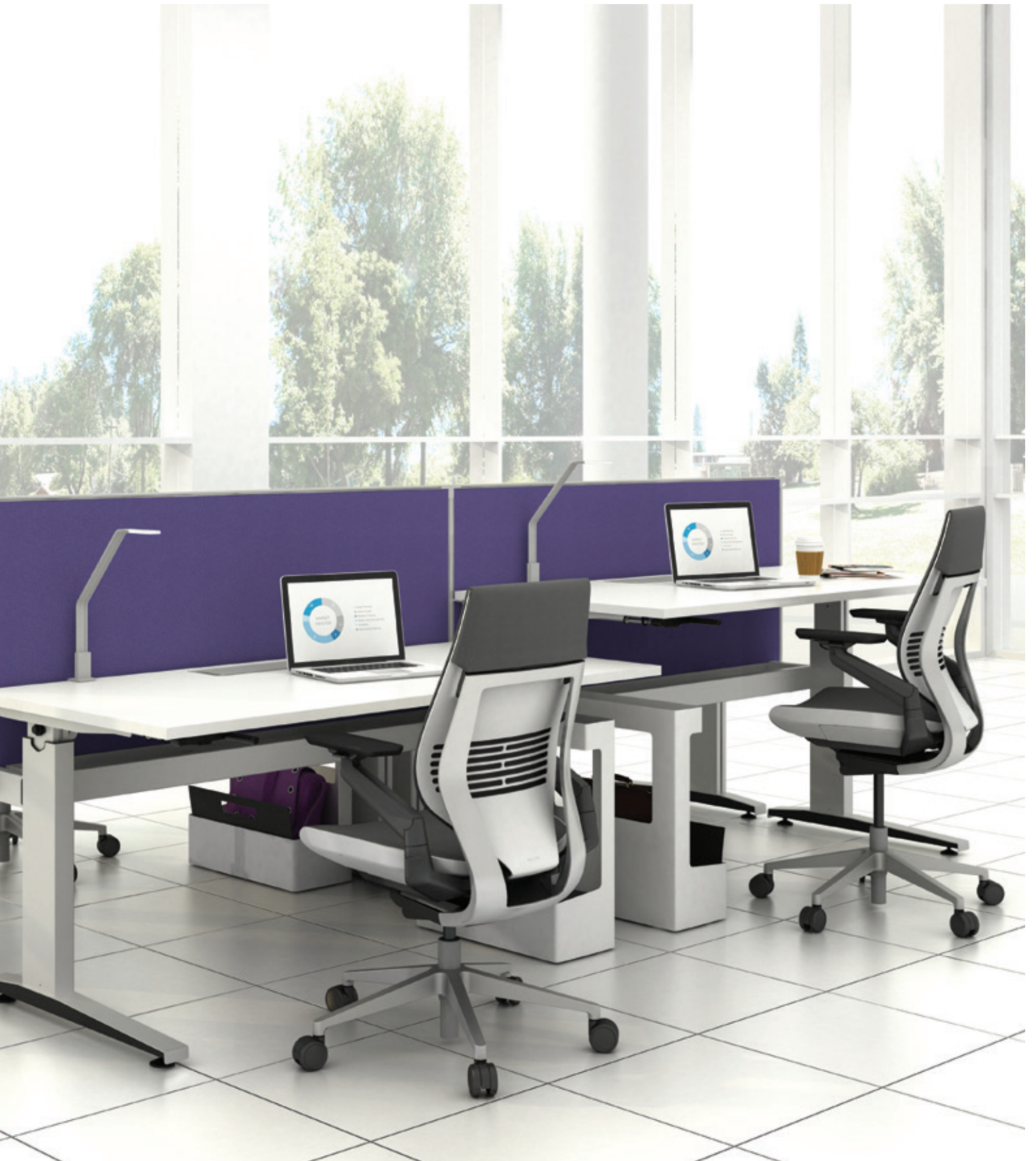
Sit2Stand height adjustable table