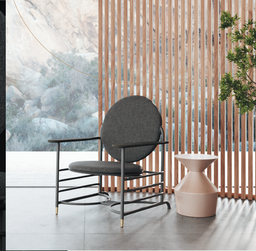
左:「フランク・ロイド・ライト・ラシーン」デスク & ゲストチェア 上:「フランク・ロイド・ライト・ラシーン」ラウンジチェア 右:「フランク・ロイド・ライト・ラシーン」ユティリティテーブル

現代にフィットする外観、絶妙なデスクのサイズ感や選択肢を広げるバリエーション豊かな仕上げを特長とし、1939年にSCジョンソンビルのために特別に設計した貴重なラウンジチェアも含まれます。