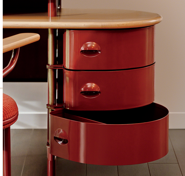
表紙:「フランク・ロイド・ライト・ラシーン」エグゼクティブデスク & ゲストチェア