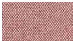
Era Pink Lemonade (プライマリー)5ER8