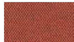
Era Scarlet (アクセント)5ES0