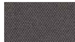
Era Night Owl (アクセント)5ES7