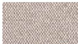
Era Comet (プライマリー)5ER5