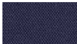
Era Royal Blue (プライマリー)5ES6