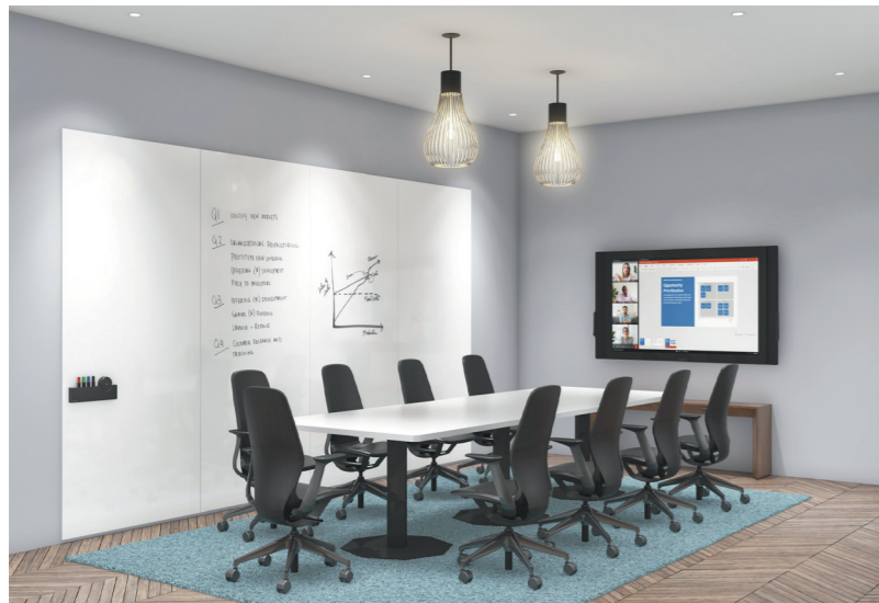
Alpine White Gloss 7680 フレームレス