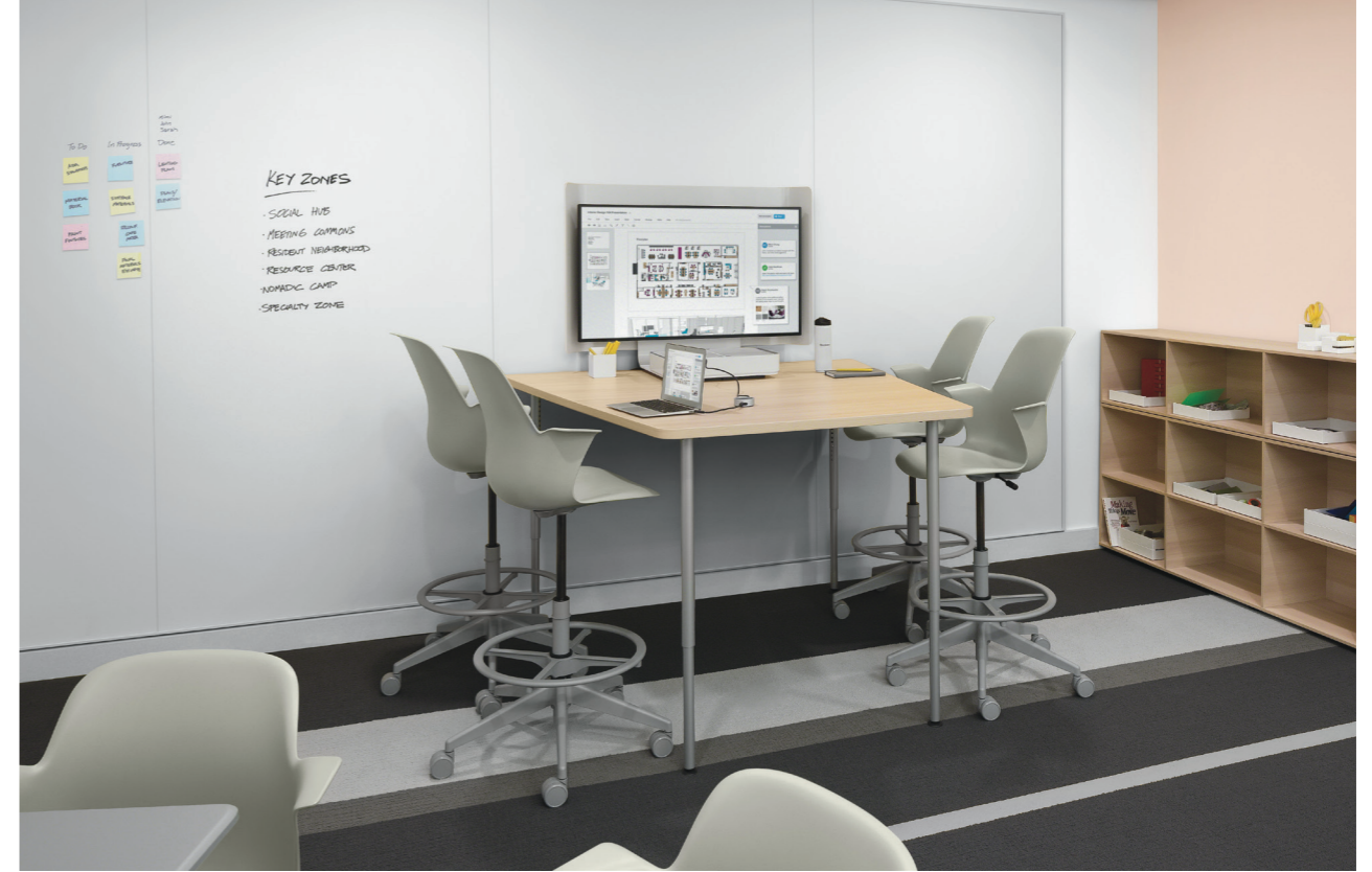
White Gloss 6100 U フレームタイプ